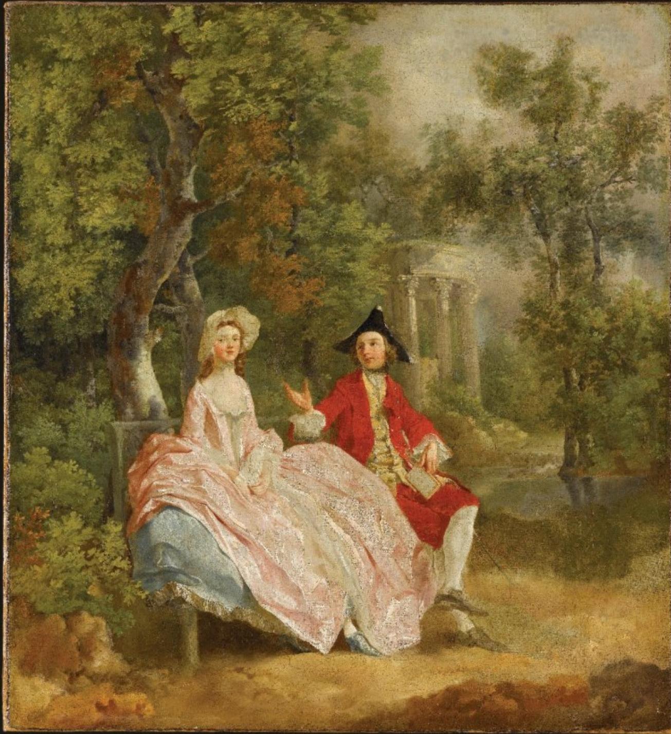
Thomas Gainsborough (Sudbury, 1727 – Londres, 1788), Couple conversant dans un parc , vers 1750, peinture à l'huile sur toile, Paris, musée du Louvre.