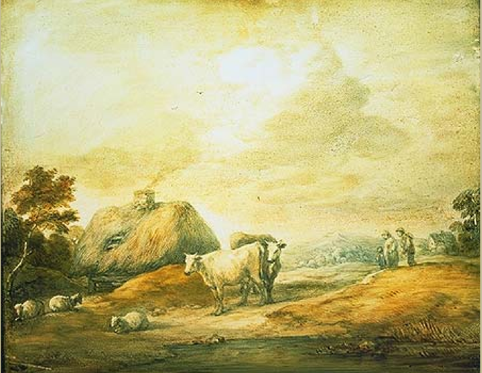
Thomas Gainsborough (Sudbury, 1727 – Londres, 1788), Paysage avec des vaches et des moutons auprès d'une ferme, 1745/6, peinture sur verre, Londres, Victoria & Albert Museum.