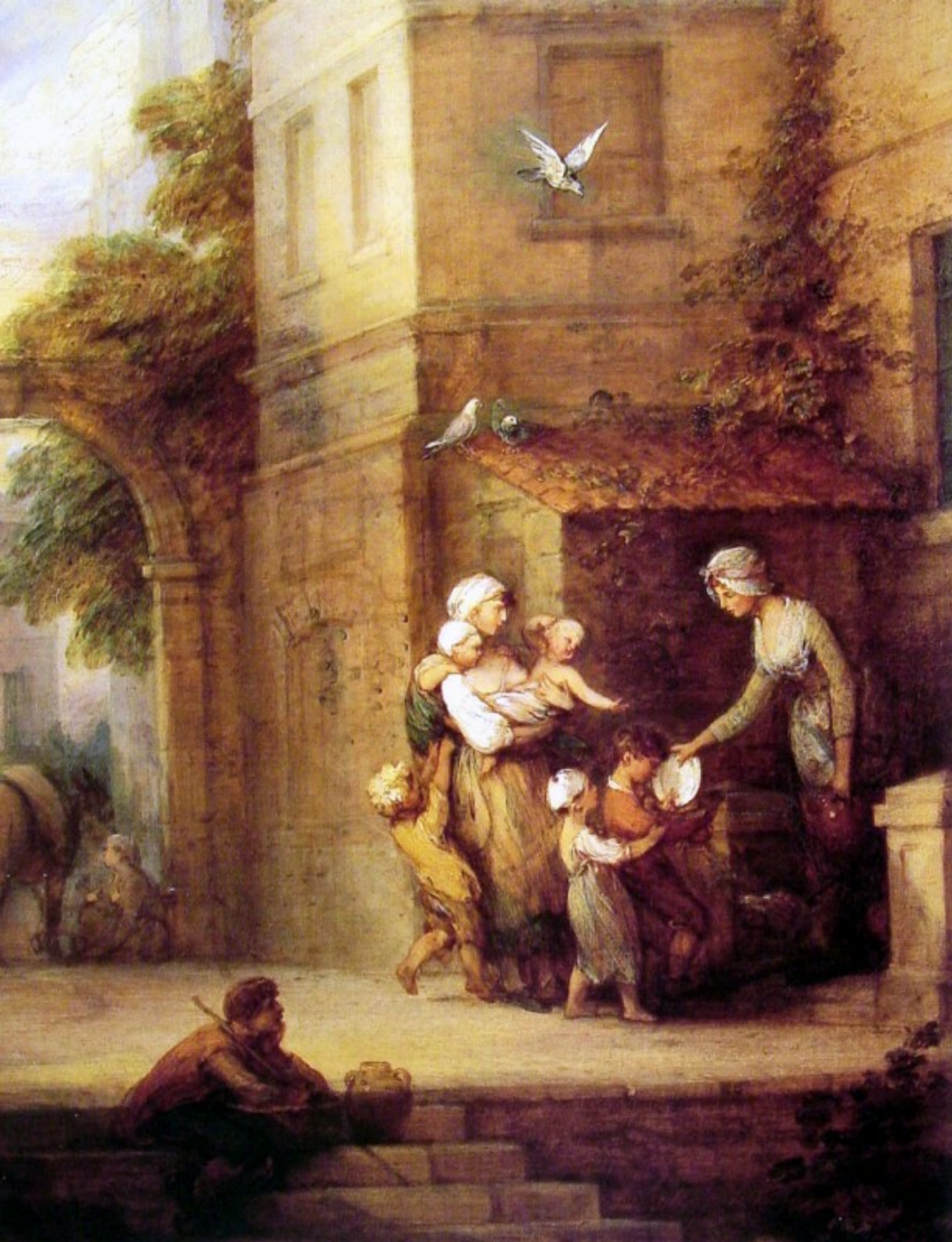
Thomas Gainsborough (Sudbury, 1727 – Londres, 1788), La Charité assistant la Détresse , vers 1784, peinture à l'huile sur toile, Sudbury, Gainsborough's House.