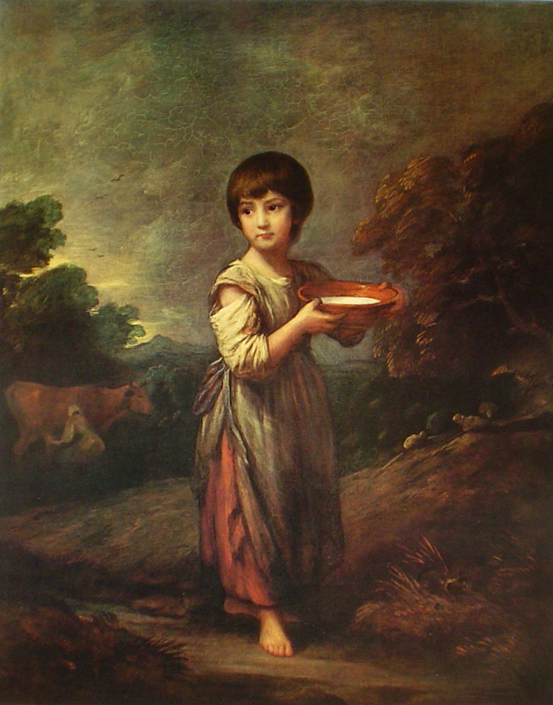
Thomas Gainsborough (Sudbury, 1727 – Londres, 1788), Lavinia, la jeune laitière, vers 1786, peinture à l'huile sur toile, Le Cap, South African National Gallery.