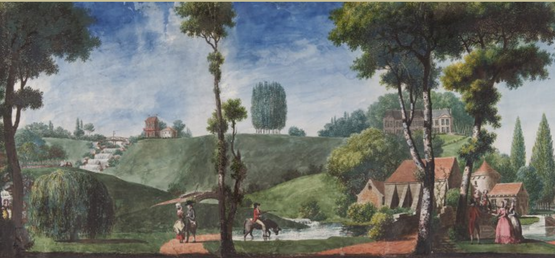
Louis Carrogis, dit Carmontelle (Paris, 1717 – Paris, 1806), Rouleau transparent (détail) : Promenade dans un parc, vers 1760, gouache, aquarelle et encre sur papier, Paris, musée du Louvre.