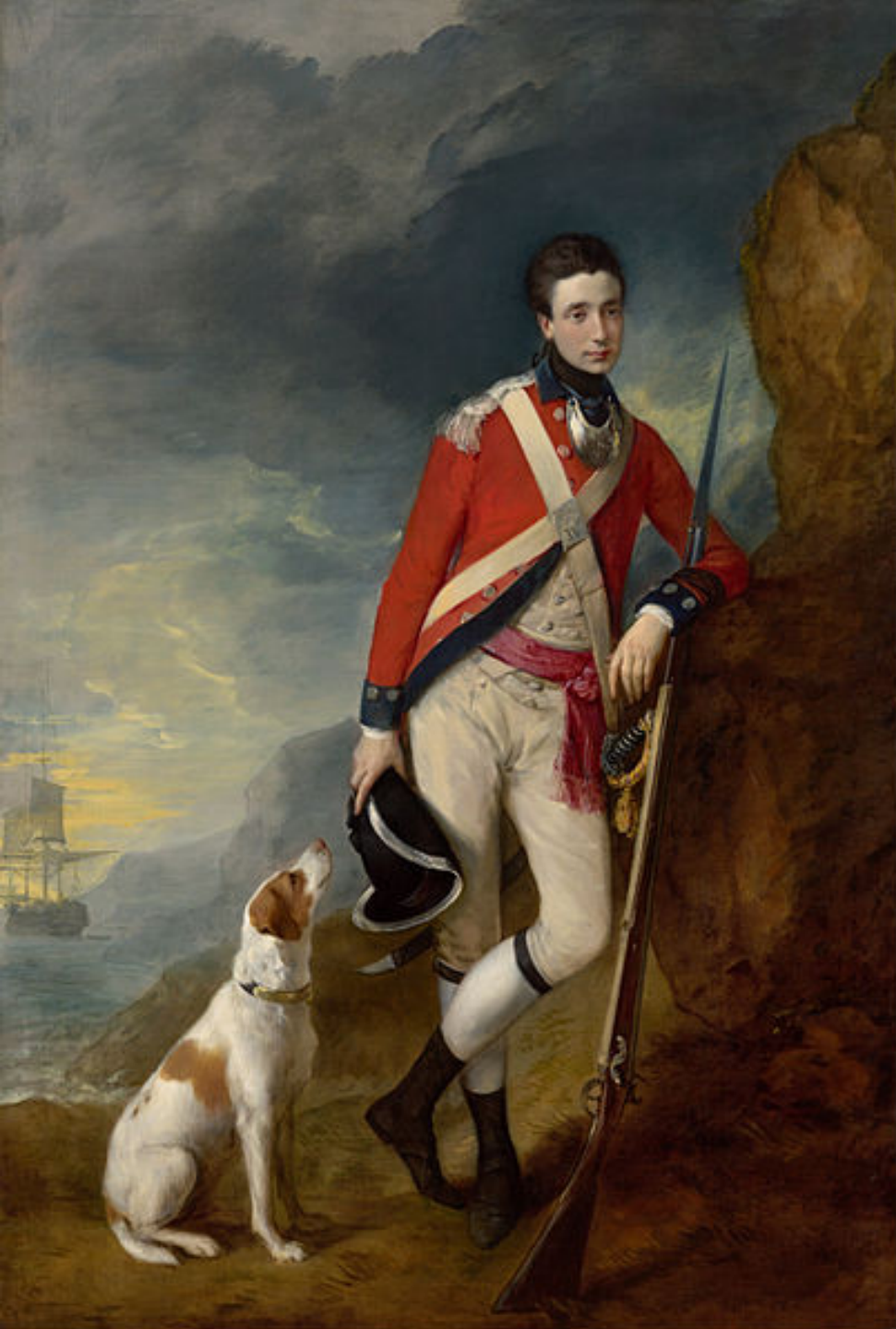
Thomas Gainsborough (Sudbury, 1727 – Londres, 1788), Portrait d'un officier , 1776/80, peinture à l'huile sur toile, Melbourne, National Gallery of Victoria.