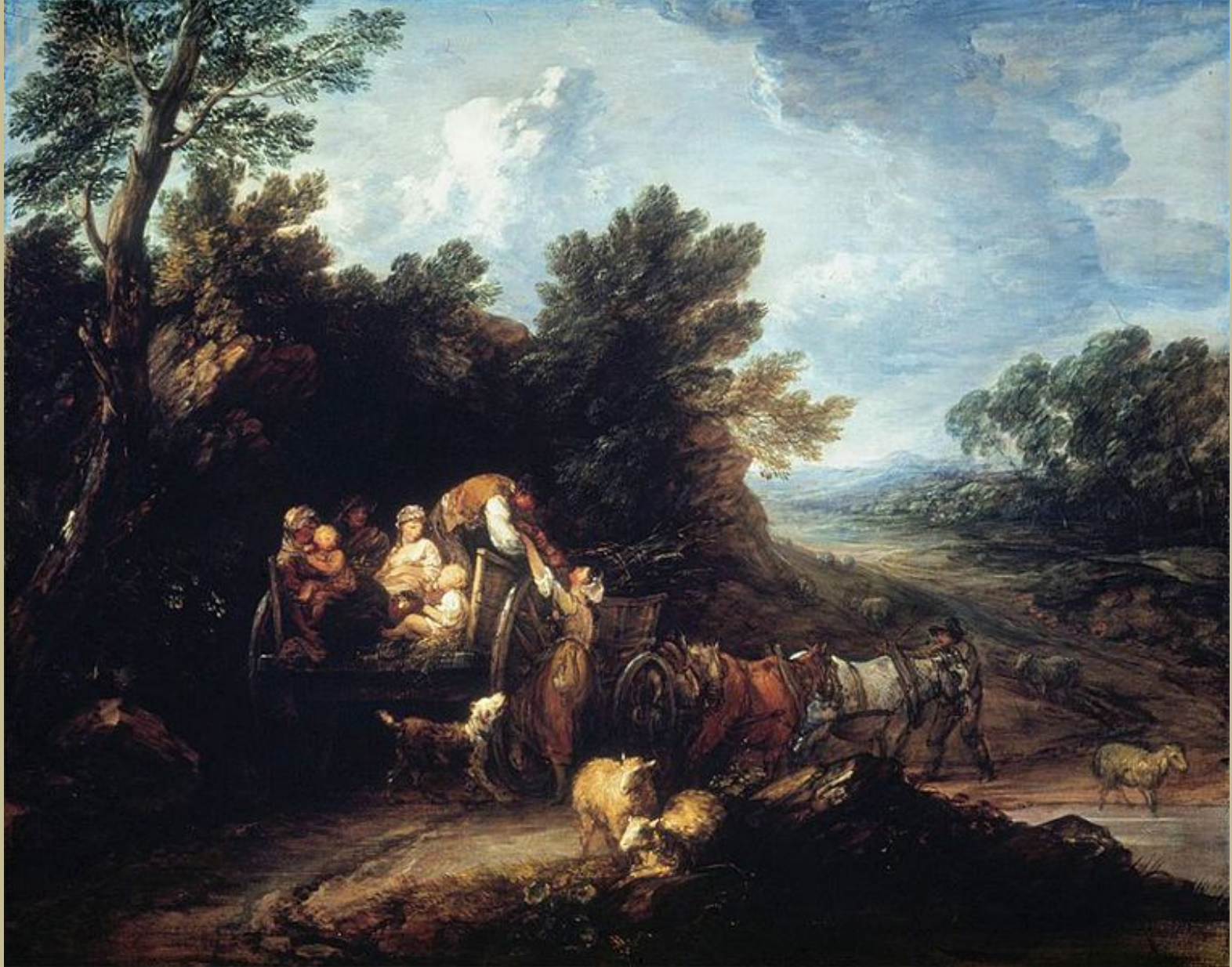
Thomas Gainsborough (Sudbury, 1727 – Londres, 1788), Le Char des moissonneurs , vers 1784, peinture à l'huile sur toile, Toronto, Art Gallery of Ontario.