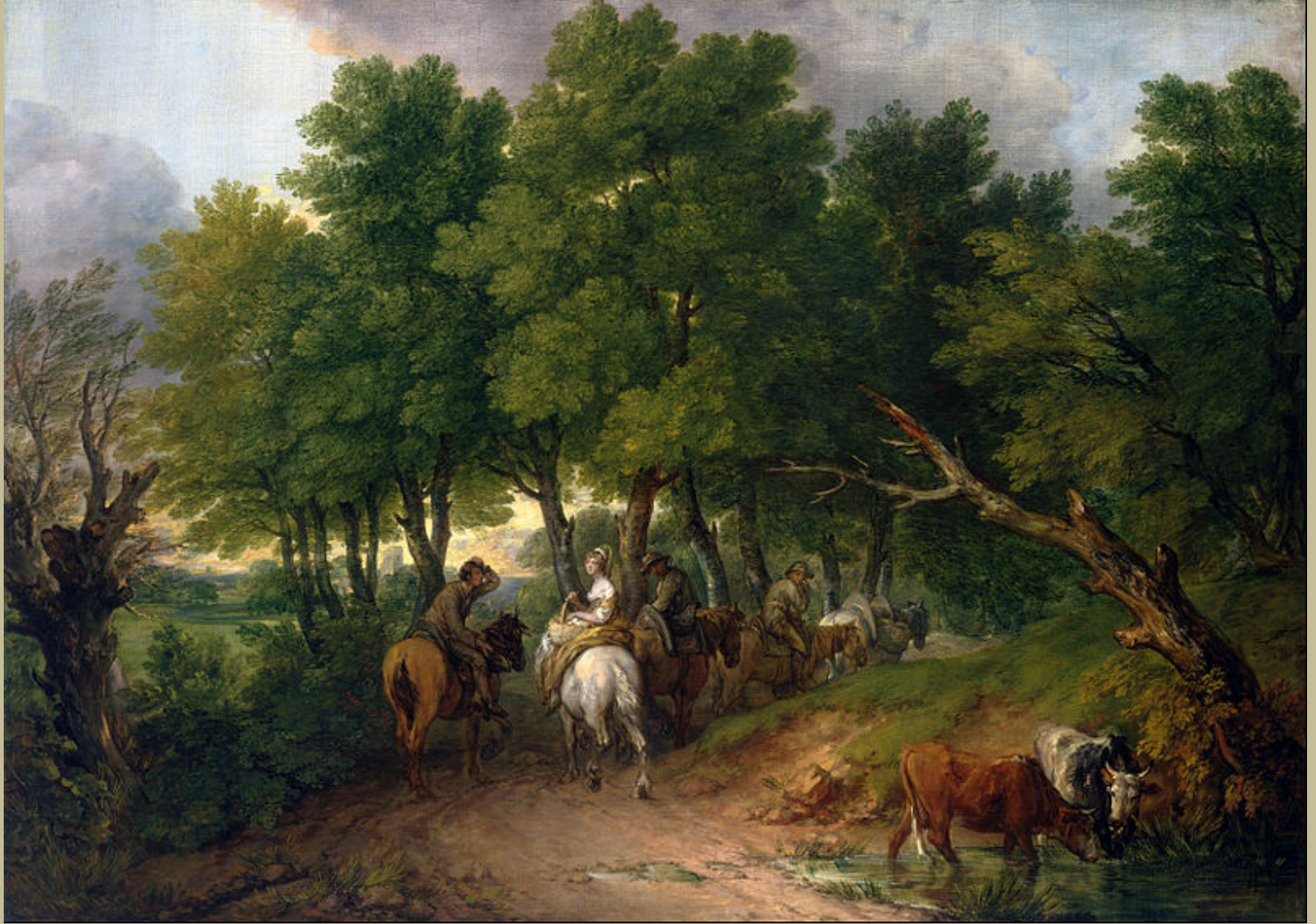
Thomas Gainsborough (Sudbury, 1727 – Londres, 1788), Le Retour du marché , 1767/8, peinture à l'huile sur toile, Toledo, Museum of Art.