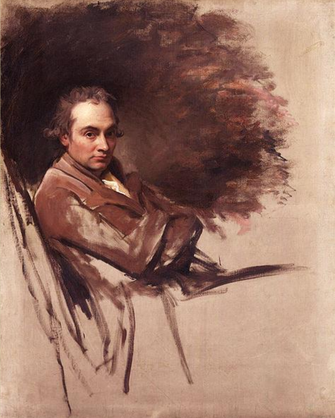
Georges Romney (Dalton-in-Furness, 1734 – Kendal, 1802), Autoportrait, vers 1775, peinture à l'huile sur toile, Londres, National Portrait Gallery.