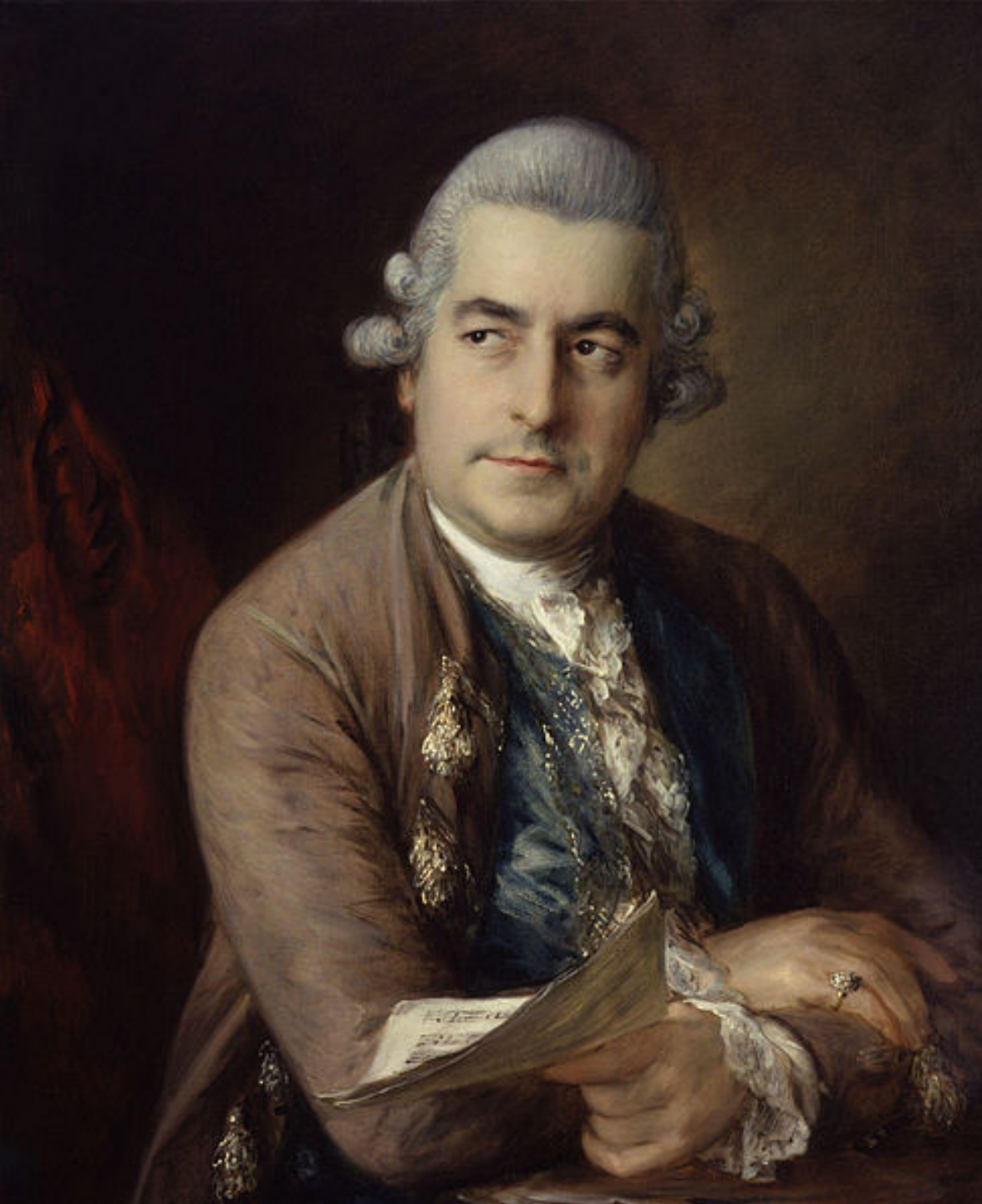
Thomas Gainsborough (Sudbury, 1727 – Londres, 1788), Portrait de Jean Chrétien Bach, 1776, peinture à l'huile sur toile, Londres, National Portrait Gallery.