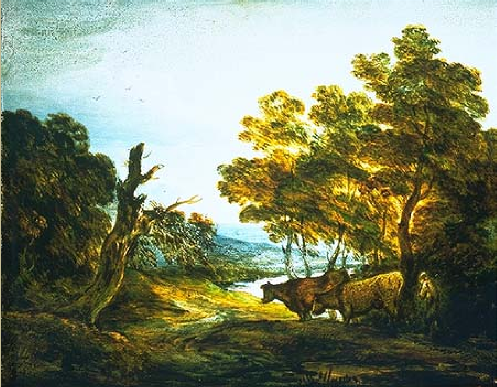
Thomas Gainsborough (Sudbury, 1727 – Londres, 1788), Paysage avec des vaches , 1745/6, peinture sur verre, Londres, Victoria & Albert Museum.