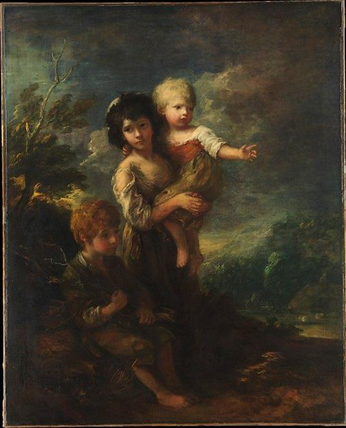
Thomas Gainsborough (Sudbury, 1727 – Londres, 1788), Famille de paysans, 1787, peinture à l'huile sur toile, New York, The Metropolitan Museum of Art.