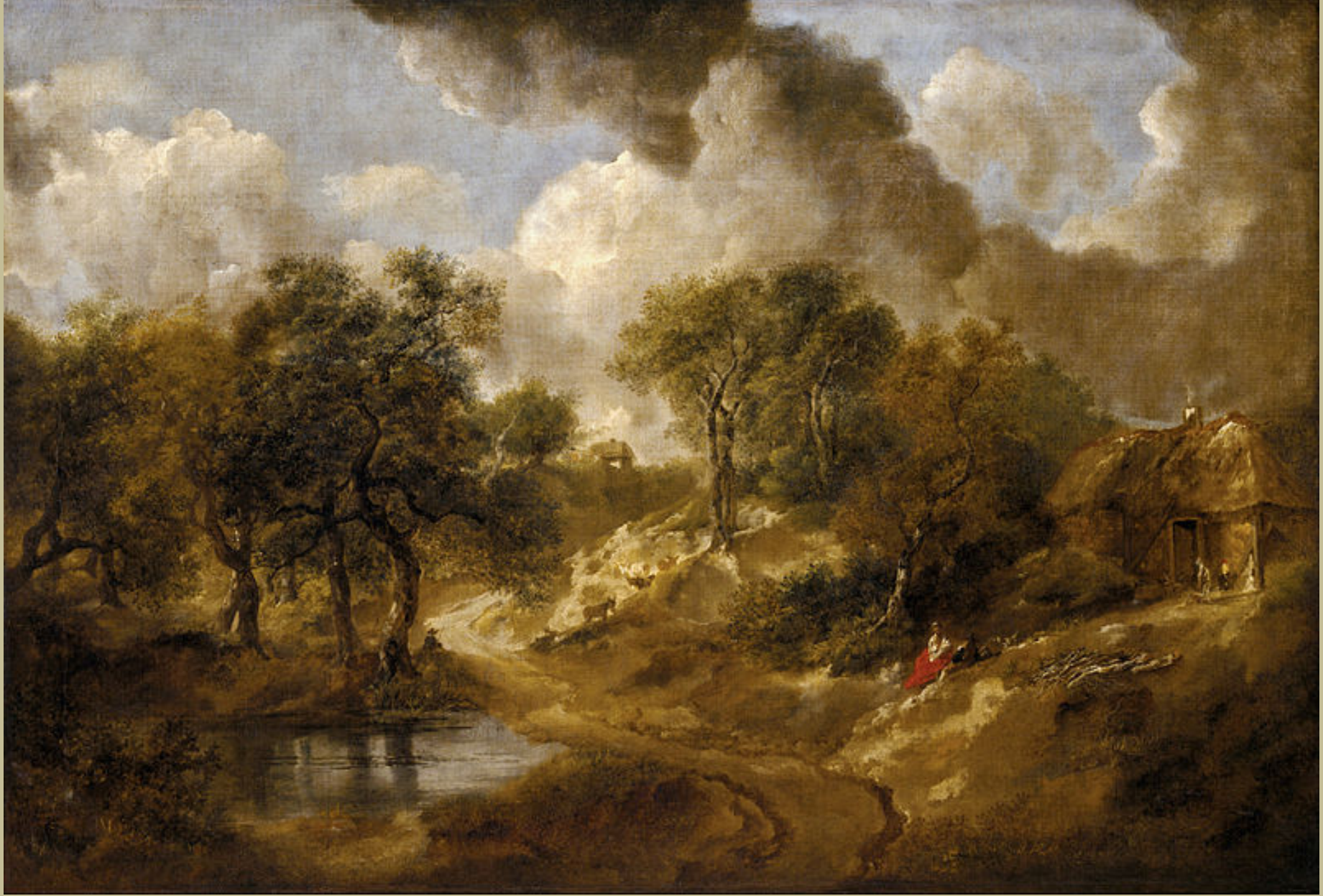
Thomas Gainsborough (Sudbury, 1727 – Londres, 1788), Paysage du Suffolk , 1746/50, peinture à l'huile sur toile, Vienne, Kunsthistorisches Museum.