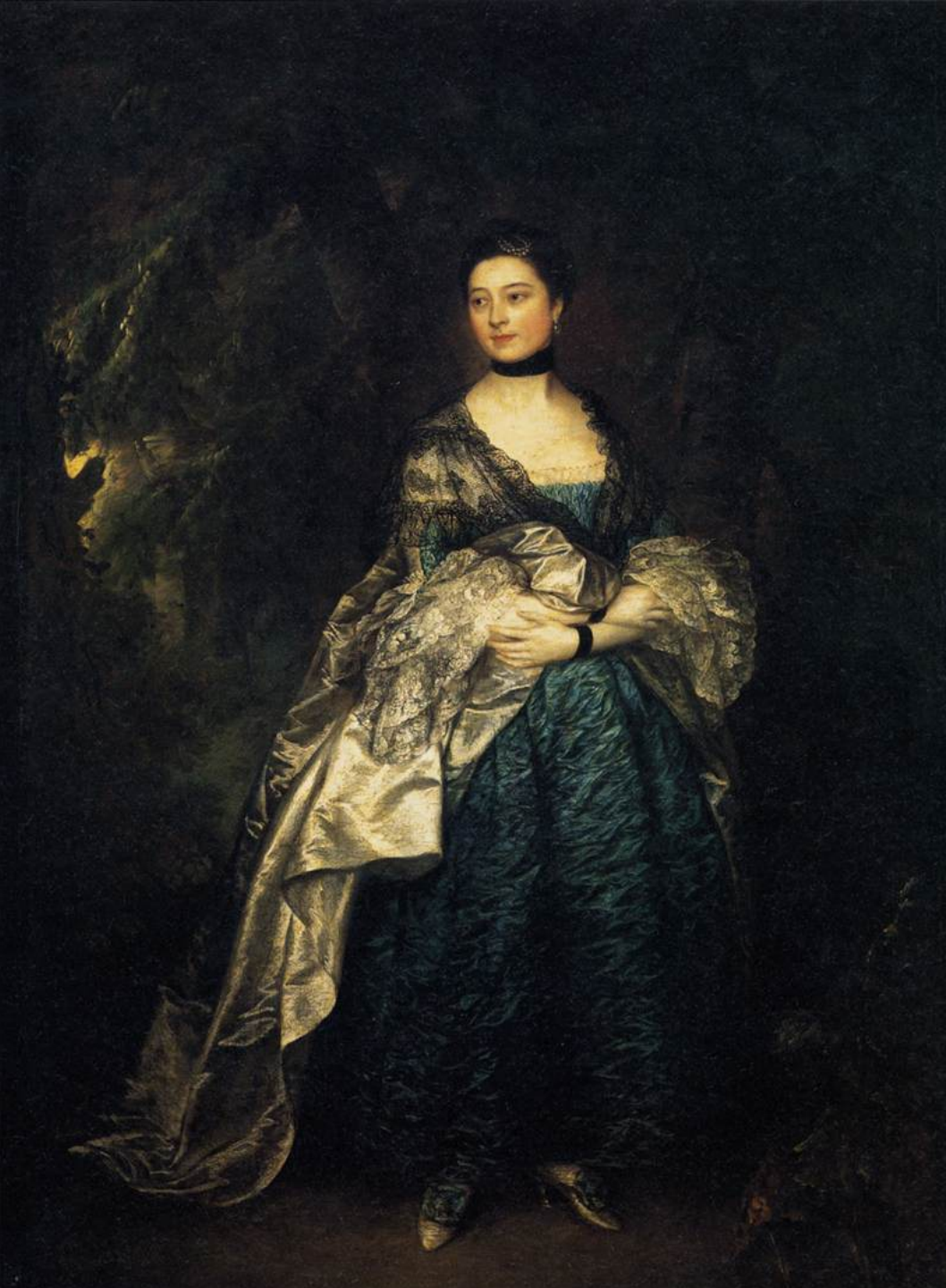
Thomas Gainsborough (Sudbury, 1727 – Londres, 1788), Portrait de Lady Alston , 1760/5, peinture à l'huile sur toile, Paris, musée du Louvre.