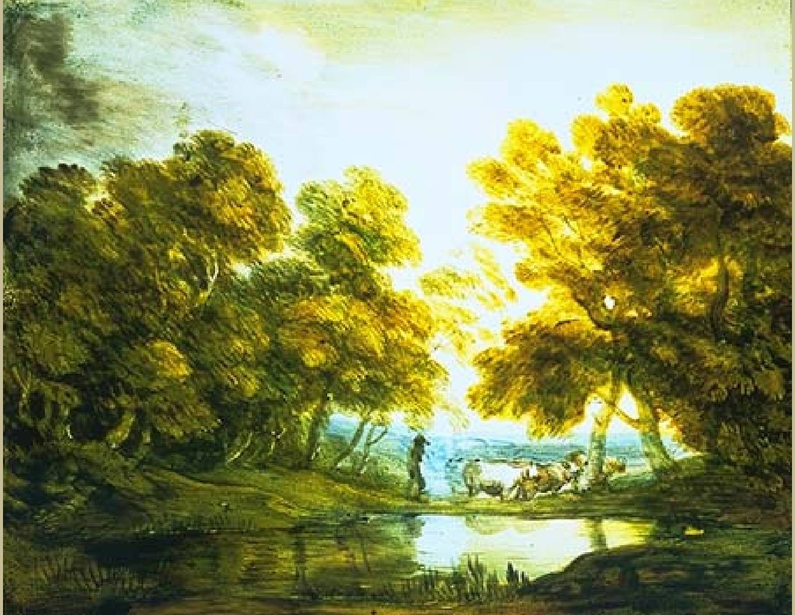
Thomas Gainsborough (Sudbury, 1727 – Londres, 1788), Paysage avec un paysan conduisant un troupeau , 1745/6, peinture sur verre, Londres, Victoria & Albert Museum.