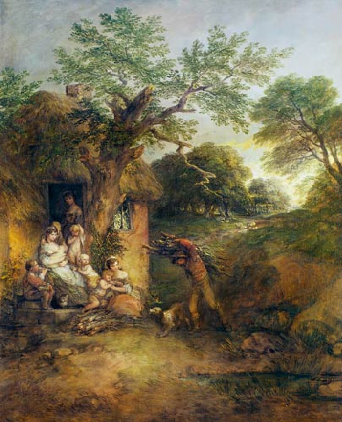
Thomas Gainsborough (Sudbury, 1727 – Londres, 1788), La Cabane du bûcheron , vers 1785, peinture à l'huile sur toile, Londres, National Gallery.