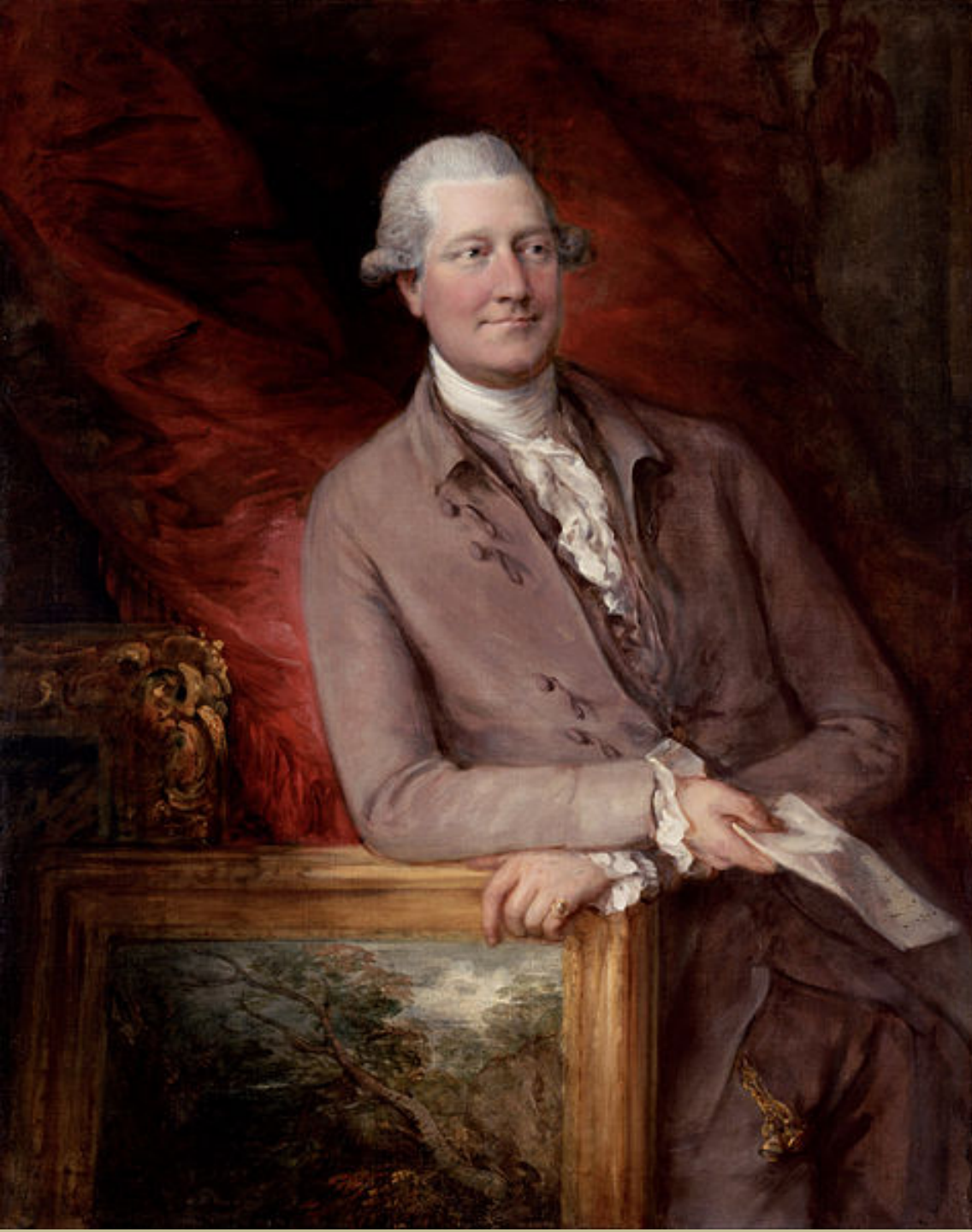
Thomas Gainsborough (Sudbury, 1727 – Londres, 1788), Portrait de James Christie, 1778, peinture à l'huile sur toile, Los Angeles, The J. Paul Getty Museum.