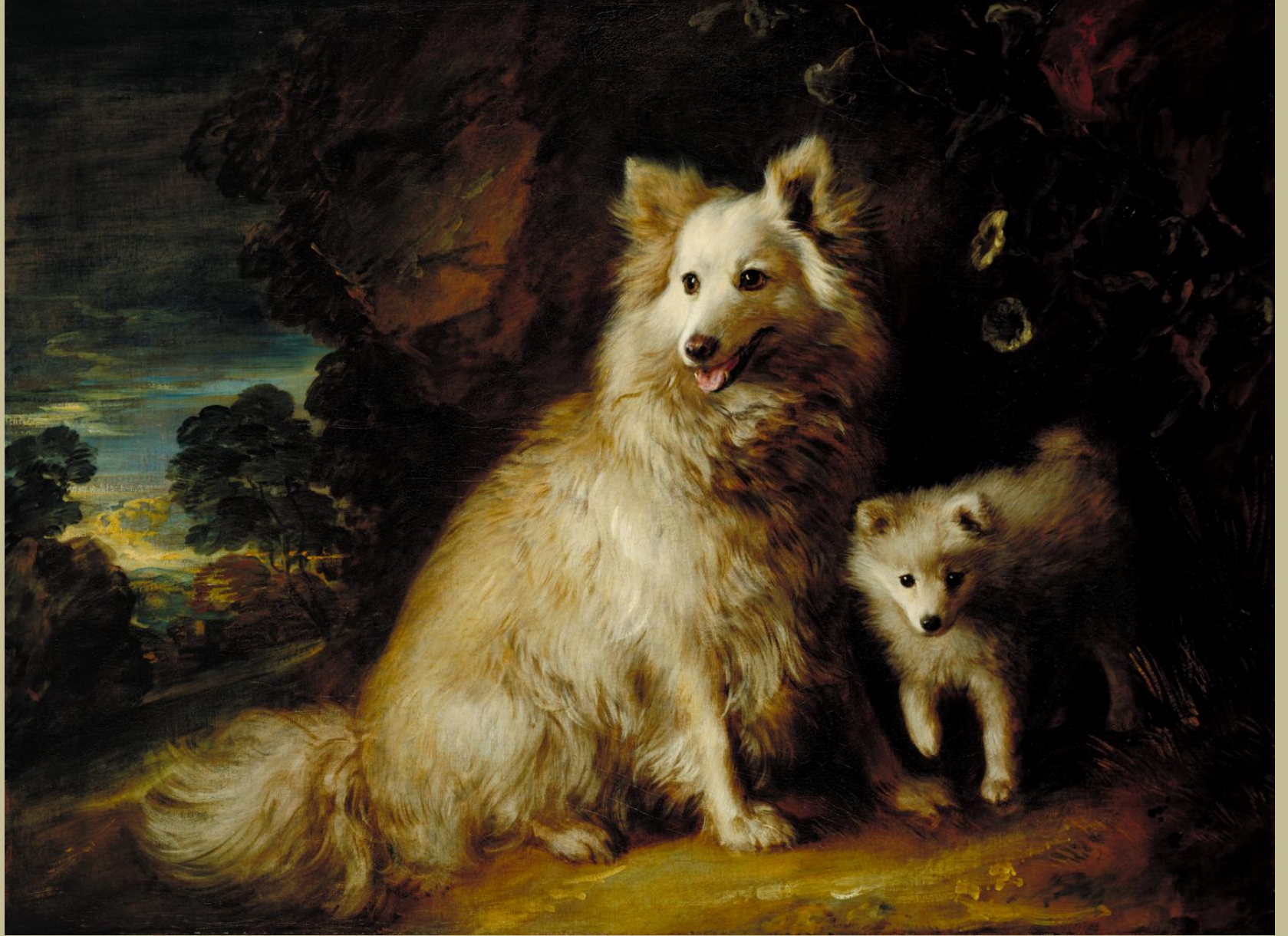
Thomas Gainsborough (Sudbury, 1727 – Londres, 1788), Loulou de Poméranie et son petit , vers 1777, peinture à l'huile sur toile, Londres, Tate Britain.