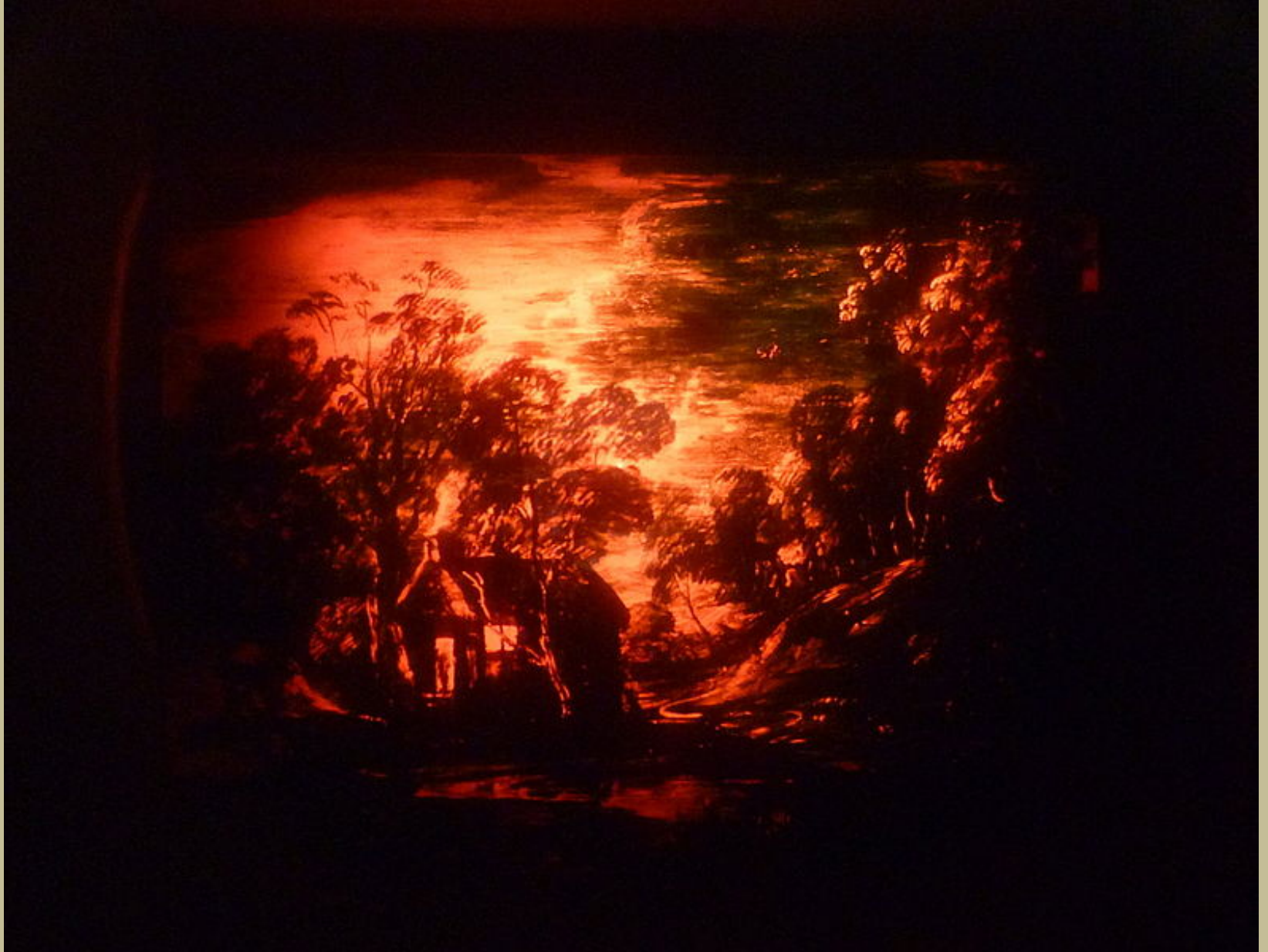
Thomas Gainsborough (Sudbury, 1727 – Londres, 1788), Paysage nocturne avec une ferme et un étang , 1745/6, peinture sur verre, Londres, Victoria & Albert Museum.