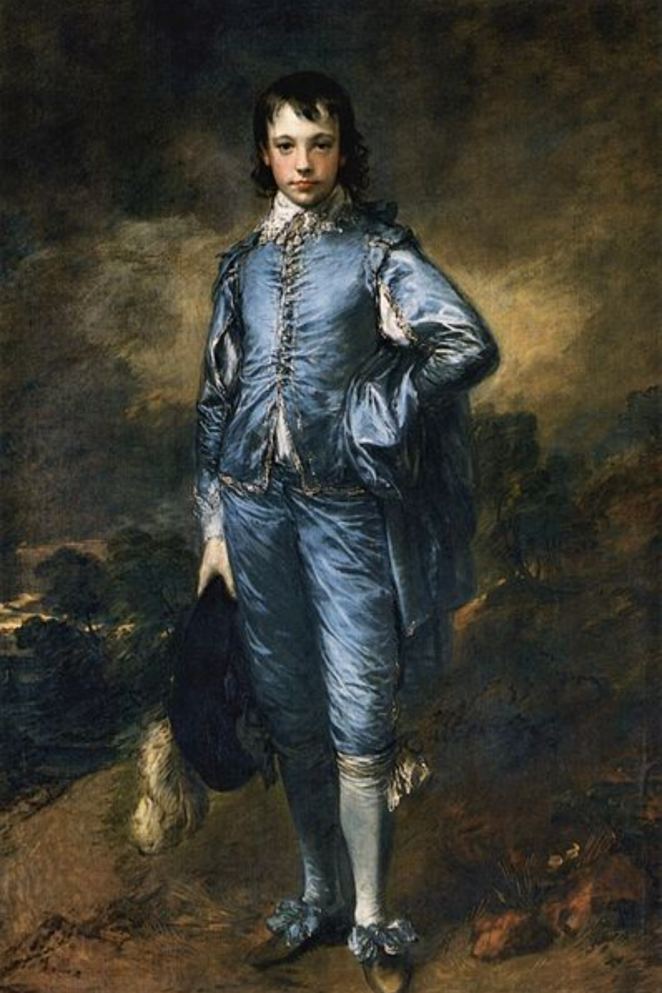
Thomas Gainsborough (Sudbury, 1727 – Londres, 1788), Portrait de Jonathan Buttall , vers 1770, peinture à l'huile sur toile, San Marino, The Huntington Library.