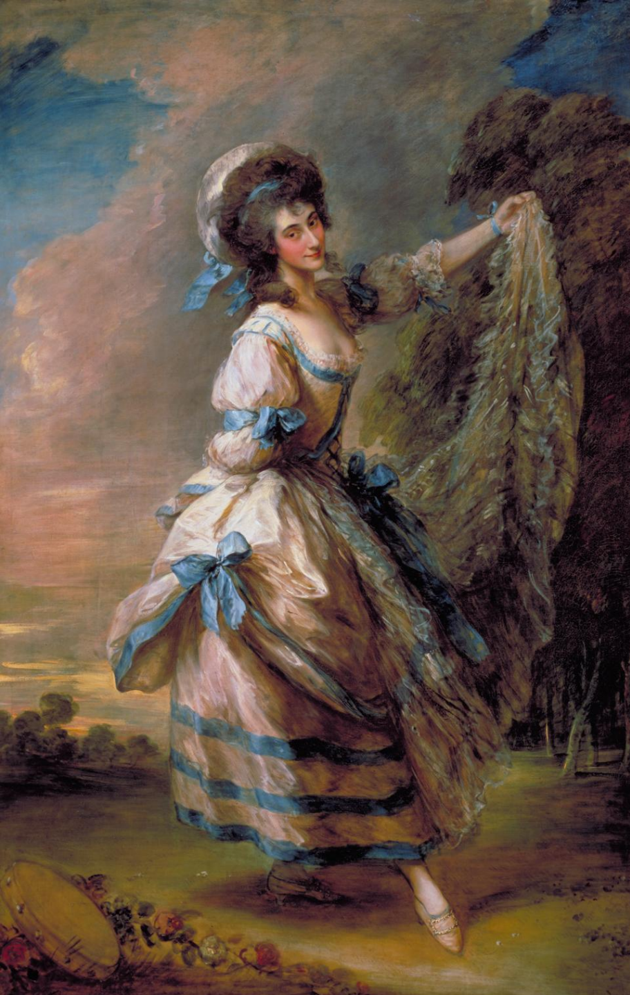
Thomas Gainsborough (Sudbury, 1727 – Londres, 1788), Portrait de Giovanna Baccelli, dans 'Les Amants surpris', 1782, peinture à l'huile sur toile, Londres, Tate Britain.