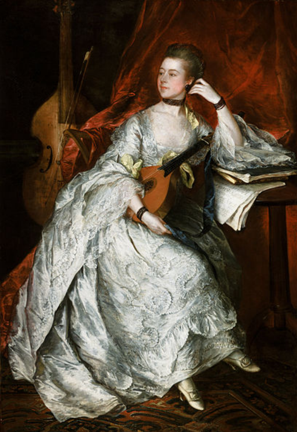
Thomas Gainsborough (Sudbury, 1727 – Londres, 1788), Portrait d'Ann Ford , 1760, peinture à l'huile sur toile, Cincinnati, Art Museum.