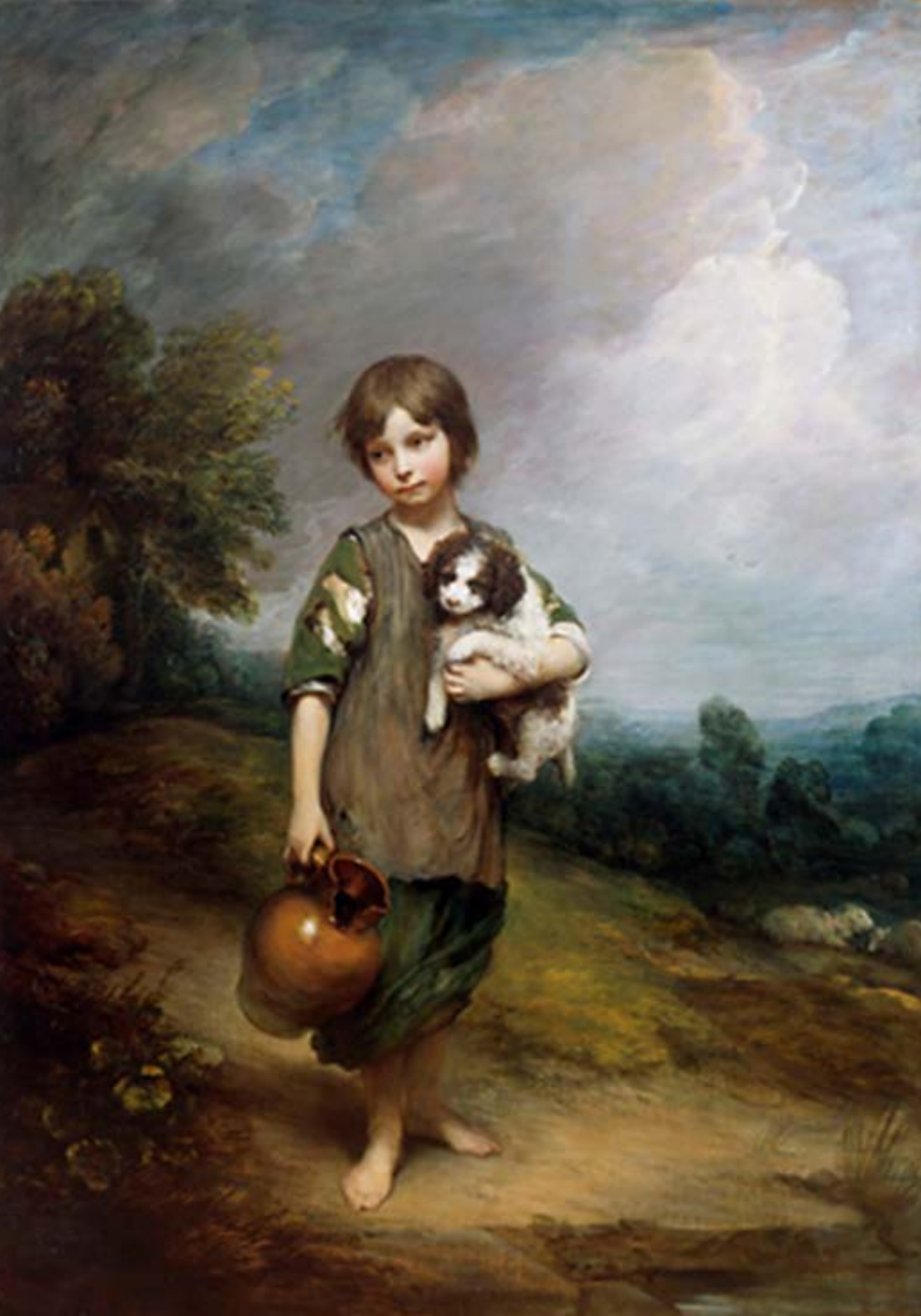
Thomas Gainsborough (Sudbury, 1727 – Londres, 1788), Jeune paysanne avec un chien et une cruche, vers 1785, peinture à l'huile sur toile, Londres, National Gallery.