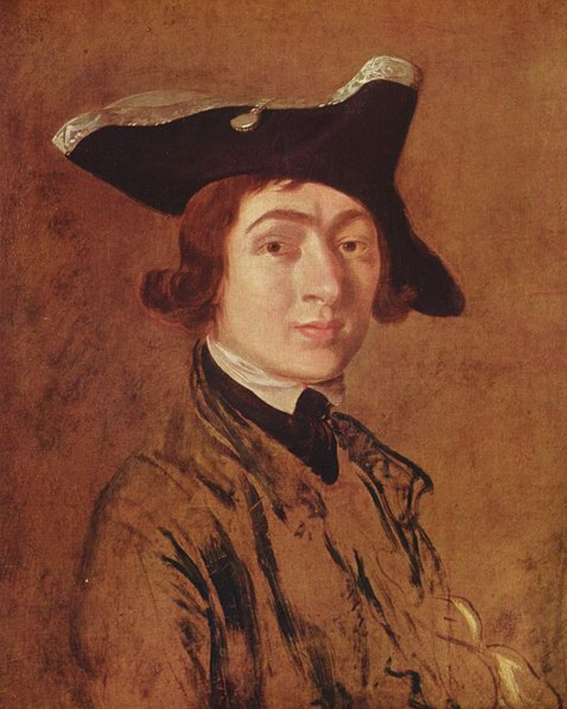
Thomas Gainsborough (Sudbury, 1727 – Londres, 1788), Autoportrait, 1754, peinture à l'huile sur toile, Houghton Hall, Norfolk.