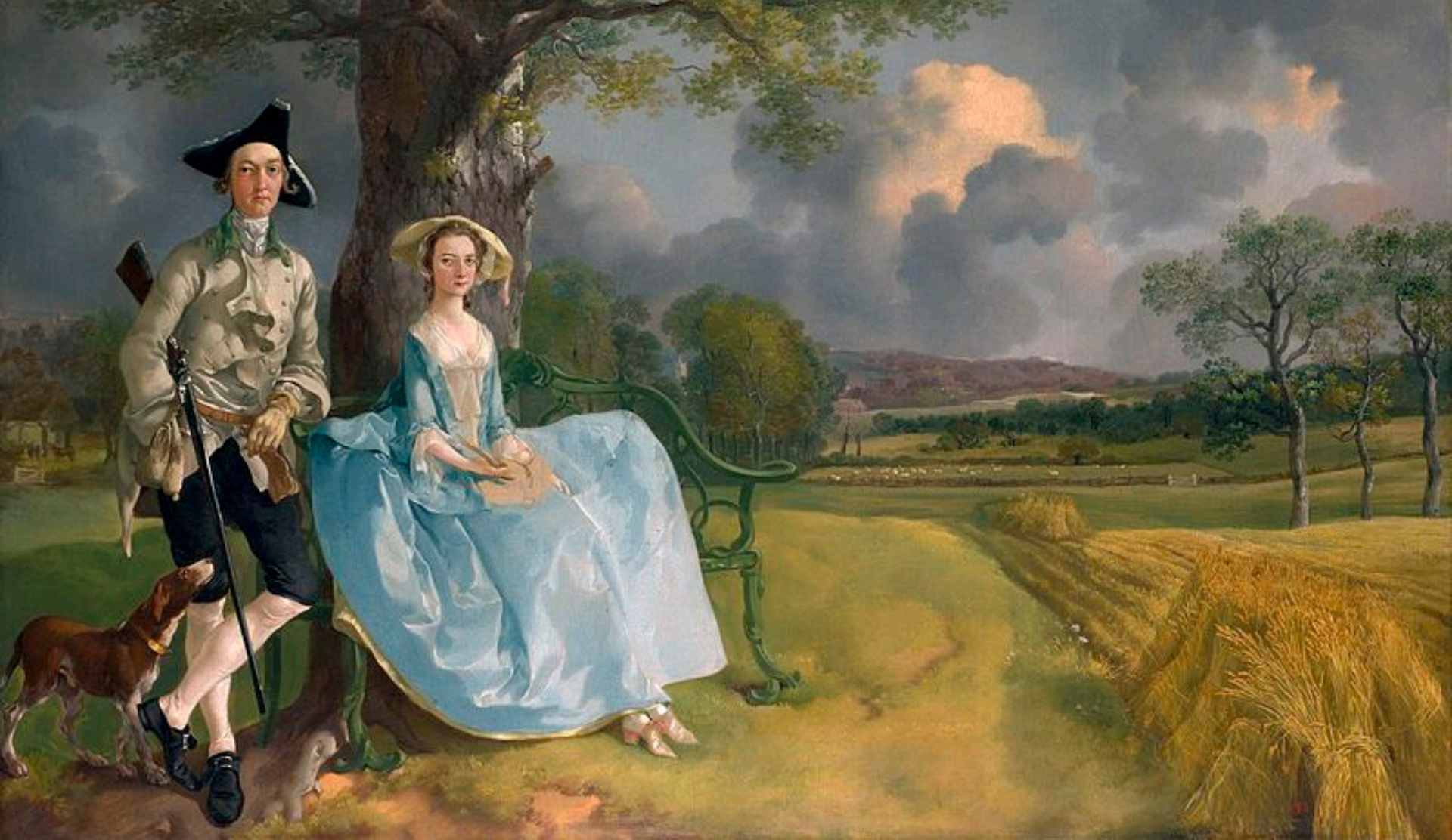
Thomas Gainsborough (Sudbury, 1727 – Londres, 1788), Portrait de Mr & Mrs Andrews , vers 1750, peinture à l'huile sur toile, Londres, National Gallery.