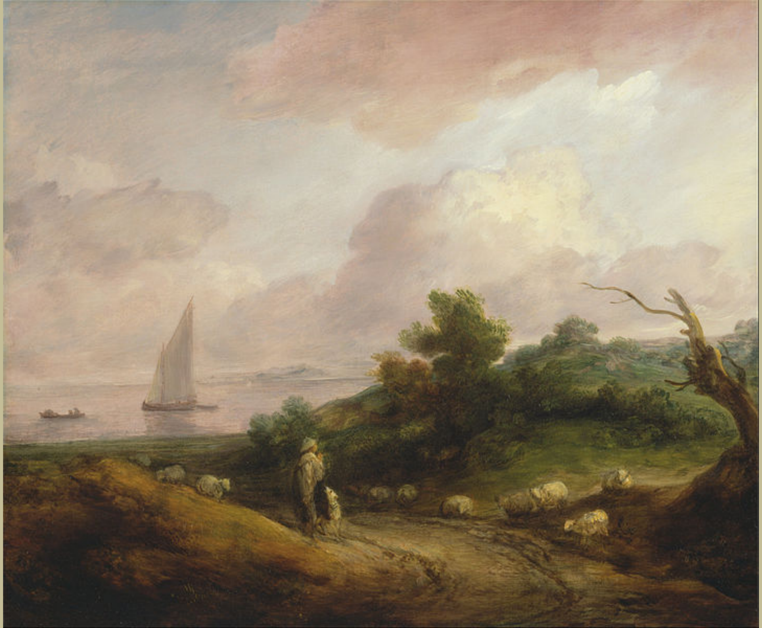
Thomas Gainsborough (Sudbury, 1727 – Londres, 1788), Paysage côtier avec un berger et son troupeau , 1783/4, peinture à l'huile sur toile, New Haven, Yale Center for British Art.