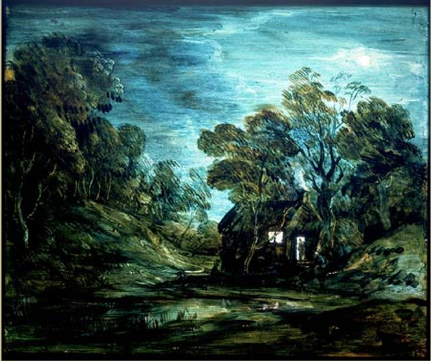
Thomas Gainsborough (Sudbury, 1727 – Londres, 1788), Paysage nocturne avec une ferme et un étang , 1745/6, peinture sur verre, Londres, Victoria & Albert Museum.