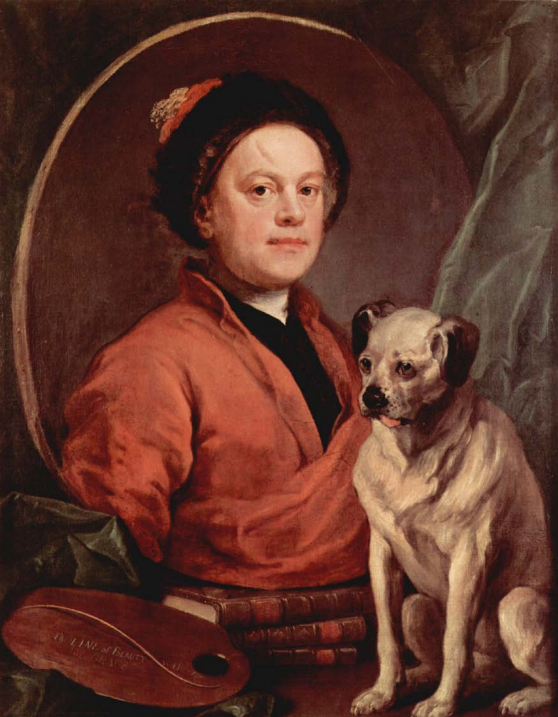
William Hogarth (Londres, 1697 – Chiswick, 1764), Autoportrait avec son carlin , 1745, peinture à l'huile sur toile, Londres, Tate Britain.