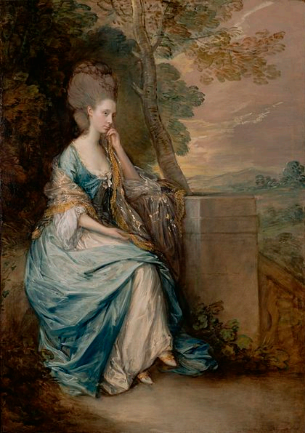
Thomas Gainsborough (Sudbury, 1727 – Londres, 1788), Portrait d'Ann, comtesse de Chesterfield, vers 1777/8, peinture à l'huile sur toile, Los Angeles, The J. Paul Getty Museum.