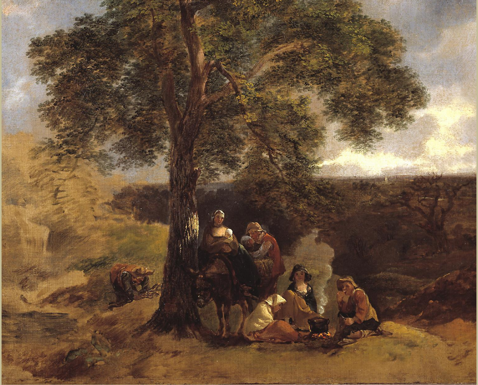
Thomas Gainsborough (Sudbury, 1727 – Londres, 1788), Campement de Bohémiens , 1753/4, peinture à l'huile sur toile, Londres, Tate Britain.