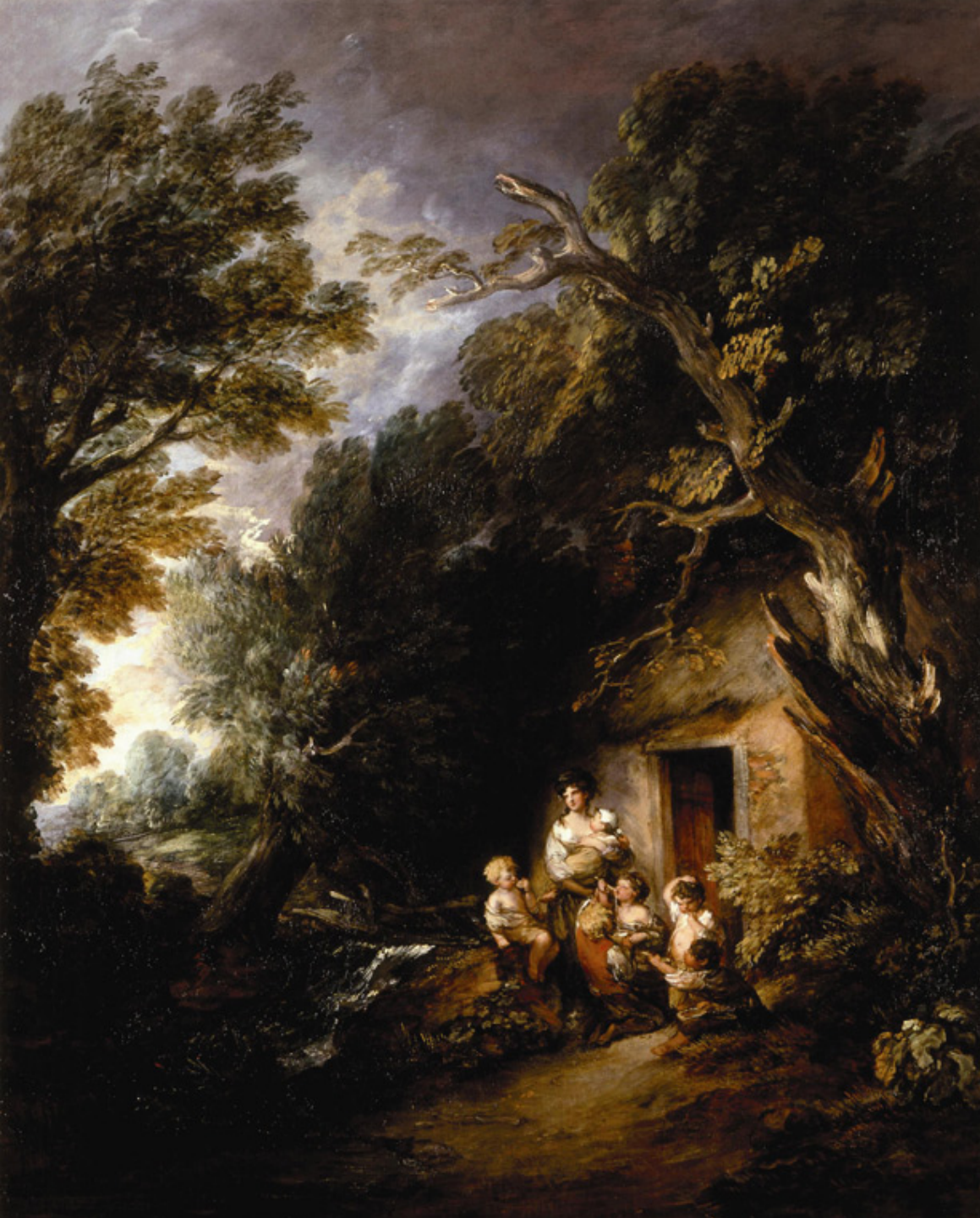
Thomas Gainsborough (Sudbury, 1727 – Londres, 1788), La Porte de la ferme , vers 1780, peinture à l'huile sur toile, San Marino, The Huntington Library.