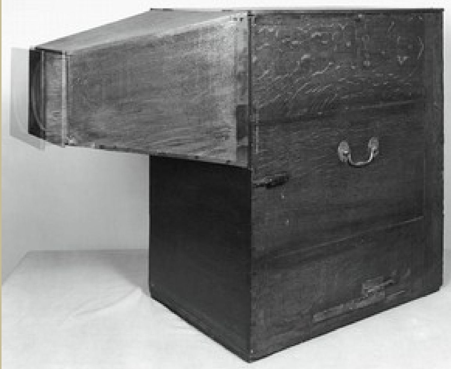
Angleterre, XVIIIe siècle, 'Showbox' de Thomas Gainsborough , vers 1780, bois et métal, Londres, Victoria & Albert Museum.