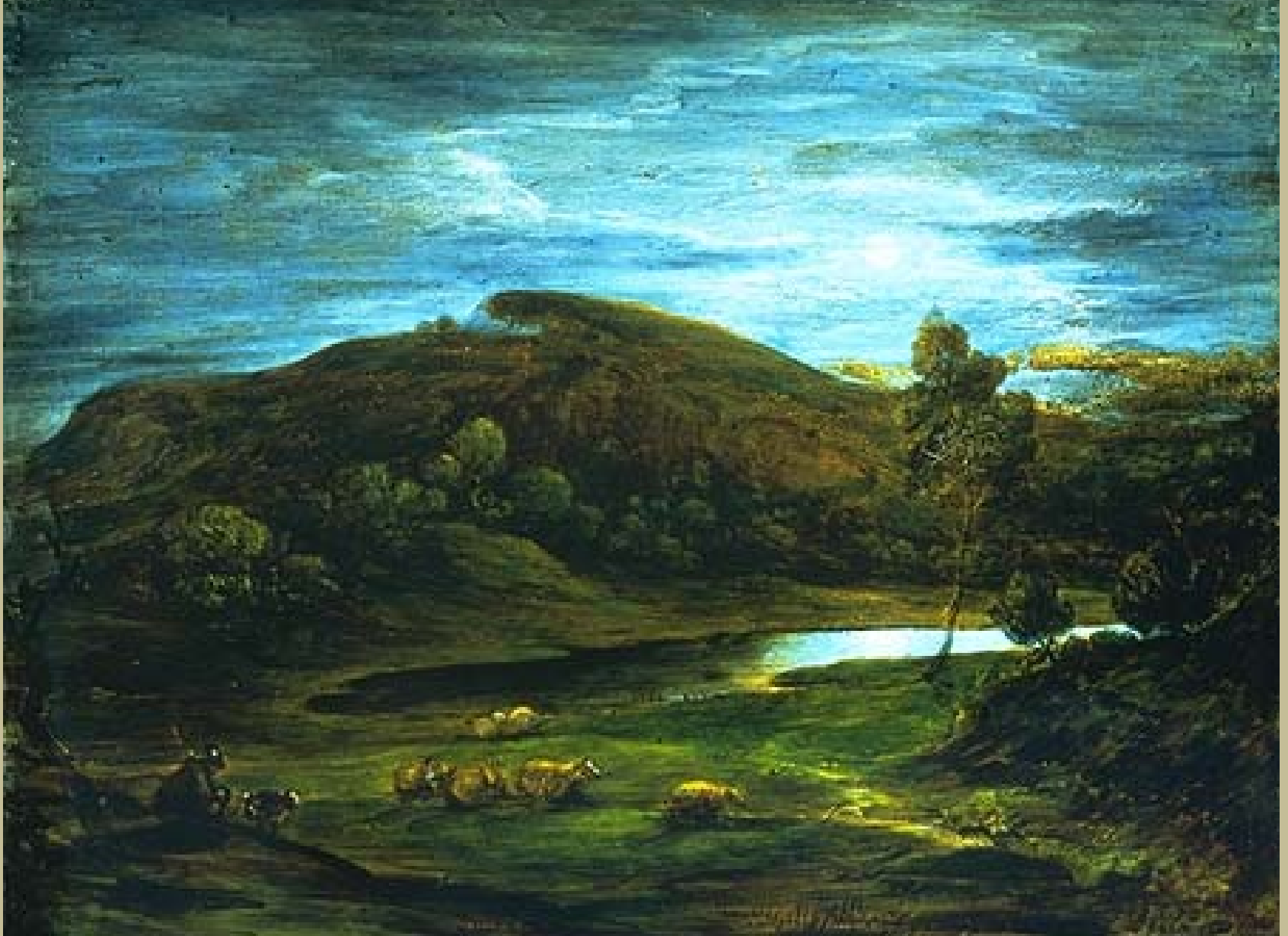
Thomas Gainsborough (Sudbury, 1727 – Londres, 1788), Paysage avec un berger et ses moutons près d'un étang , 1745/6, peinture sur verre, Londres, Victoria & Albert Museum.