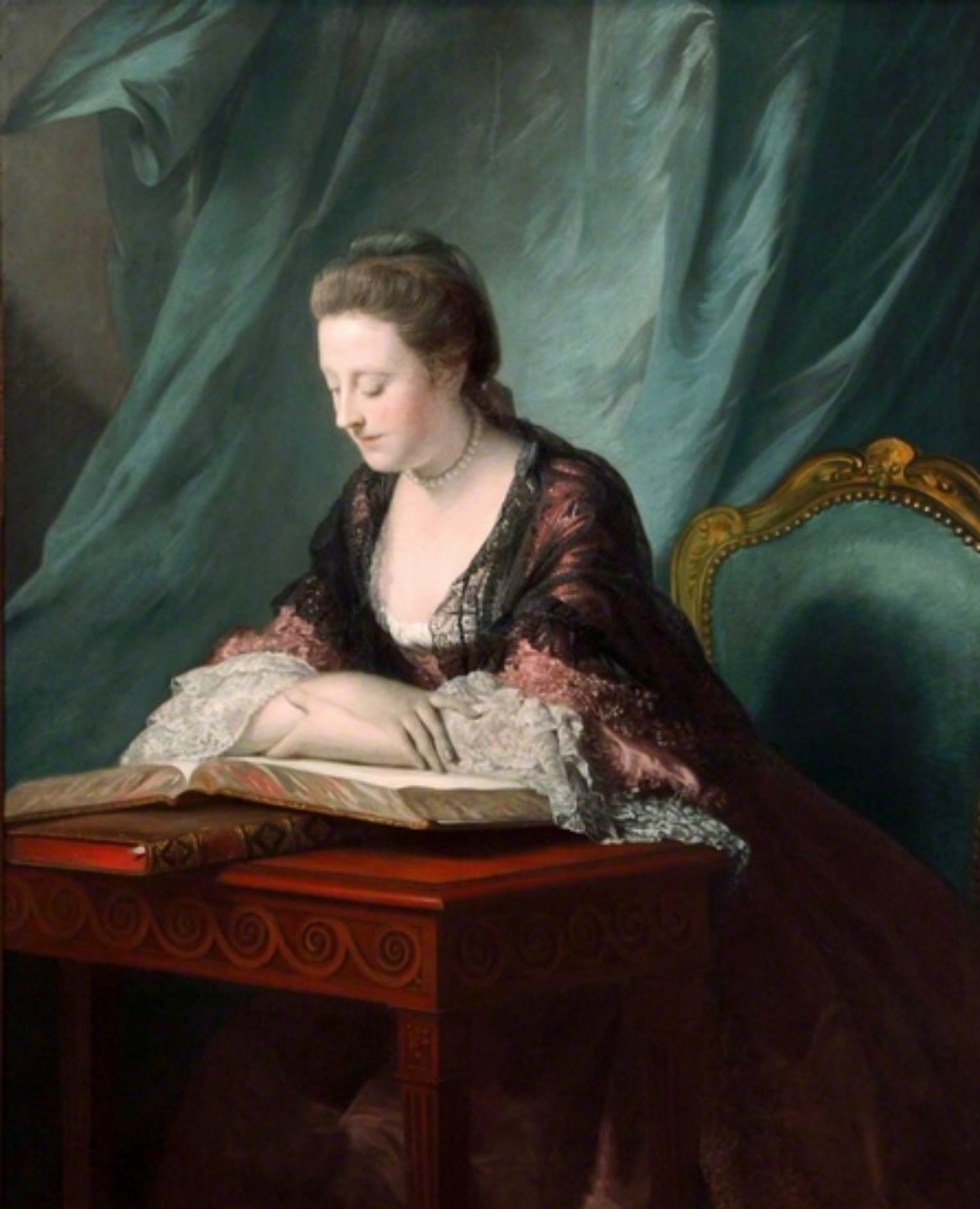
Allan Ramsay (Edimbourg, 1713 – Douvres, 1784), Portrait de Emily, comtesse de Kildare, 1765, peinture à l'huile sur toile, Liverpool, Walker Art Gallery.