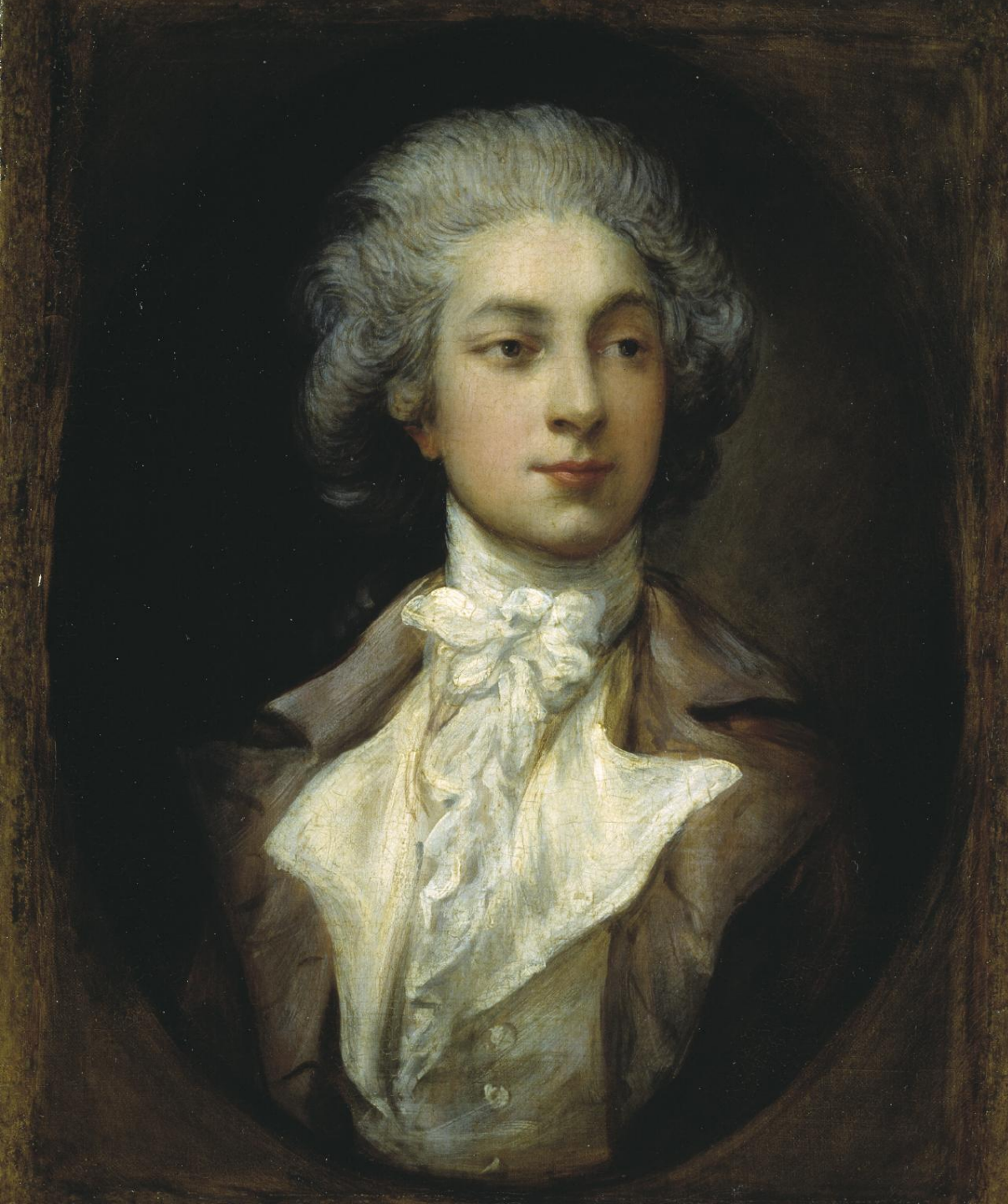
Thomas Gainsborough (Sudbury, 1727 – Londres, 1788), Portrait du danseur Marie-Jean-Augustin Vestris, 1781/2, peinture à l'huile sur toile, Londres, Tate Britain.