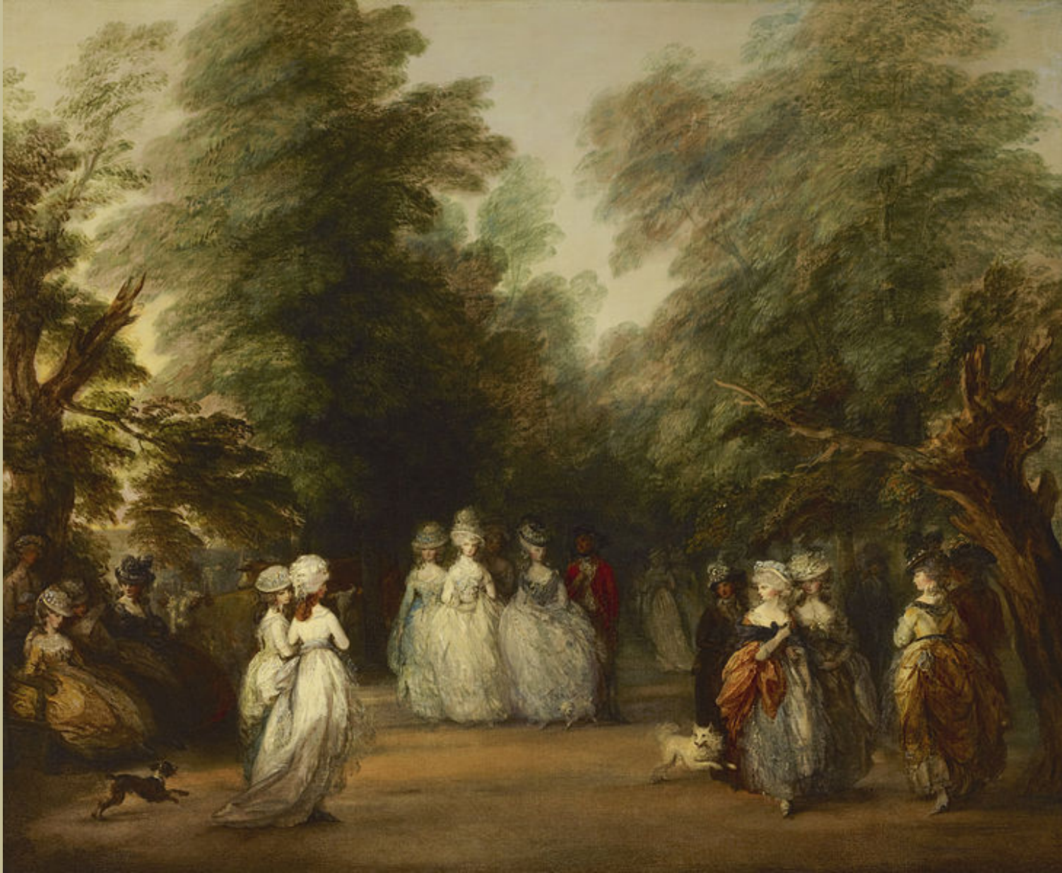
Thomas Gainsborough (Sudbury, 1727 – Londres, 1788), The Mall à St. James' Park , 1783, peinture à l'huile sur toile, New York, Frick Collection.