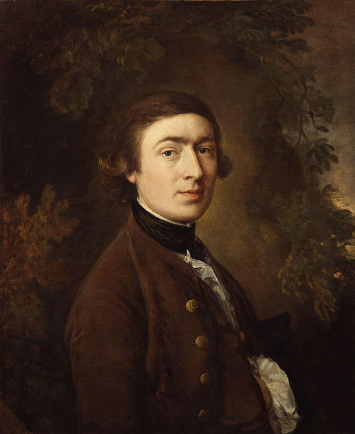
Thomas Gainsborough (Sudbury, 1727 – Londres, 1788), Autoportrait, 1758/9, peinture à l'huile sur toile, Londres, National Portrait Gallery.