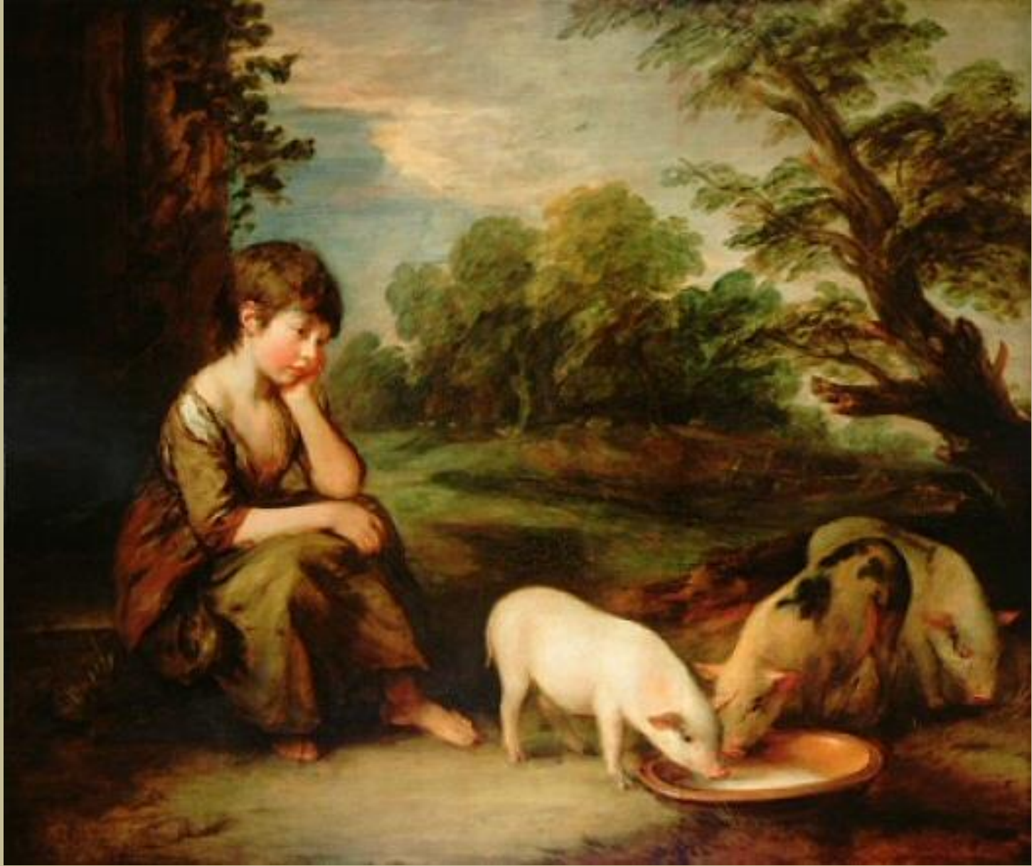
Thomas Gainsborough (Sudbury, 1727 – Londres, 1788), Jeune fille et cochons , 1781/2, peinture à l'huile sur toile, collection particulière.